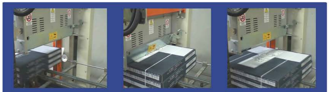
CICLO DI LAVORO WORK CYCLE.

Il marchio OMS della reggiatura The OMS strapping trade mark