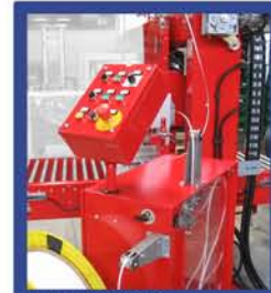
PANNELLO COMANDI OPERATOR PANEL

The control cabinet is integrated into the coil holder and is separated from the machine. The entire cycle is managed by a PLC.