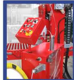
PANNELLO COMANDI OPERATOR PANEL

The control cabinet is integrated into the coil holder and is separated from the machine. The entire cycle is managed by a PLC.