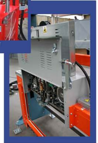
FACILE ACCESSIBILITA' EASY TO ACCESS